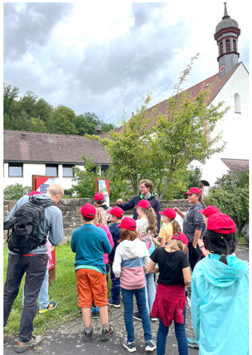
Jugendzeltlager im Kloster Schöna