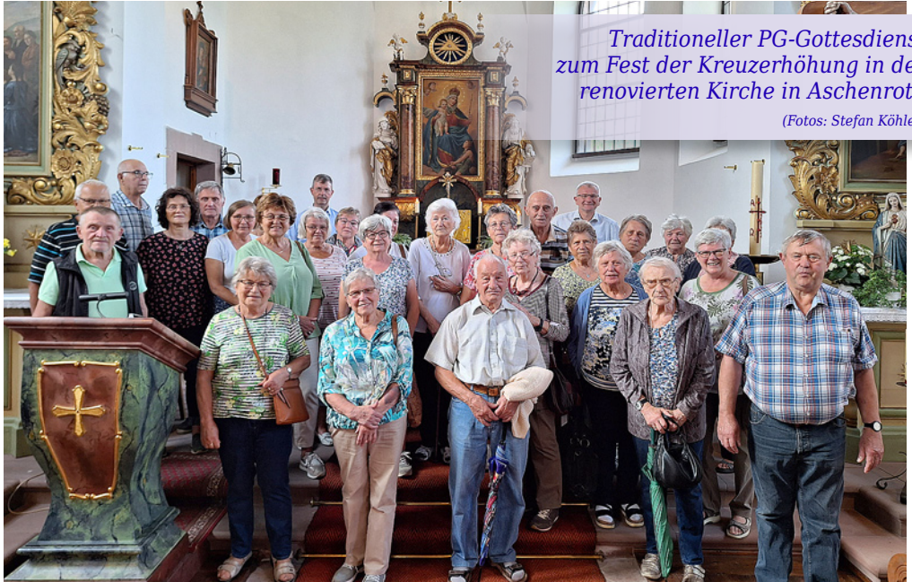
Traditioneller PG-Gottesdienst zum Fest der Kreuzerhöhung in der renovierten Kirche in Aschenroth