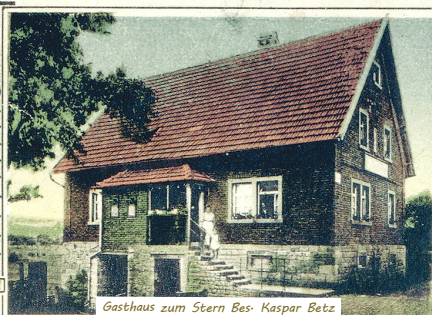
Gasthaus zum Stern Bes. Kaspar Betz