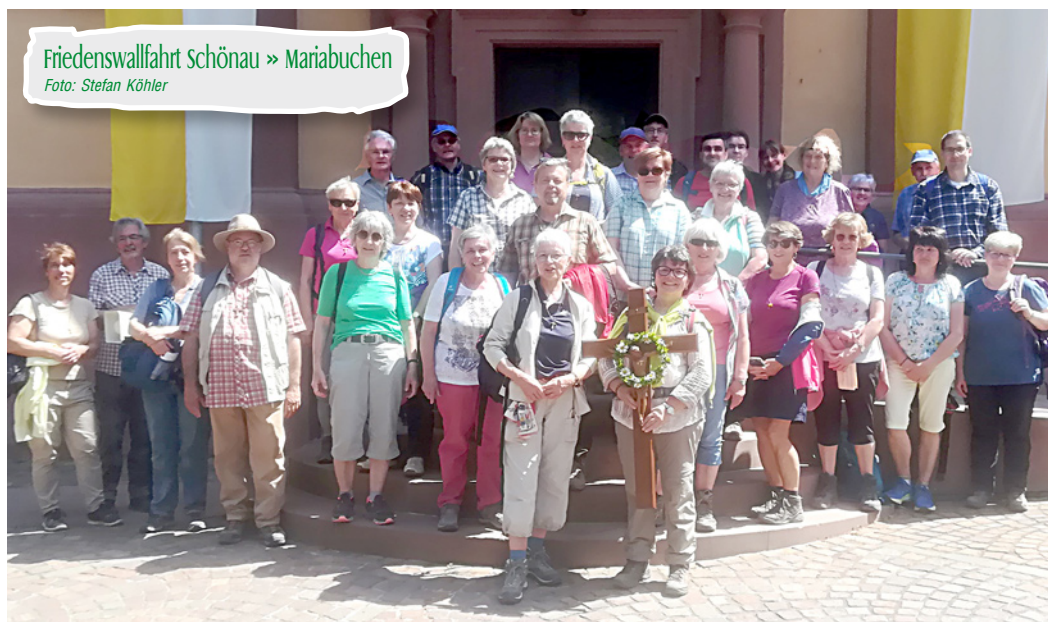
Friedenswallfahrt Schönau » Mariabuchen