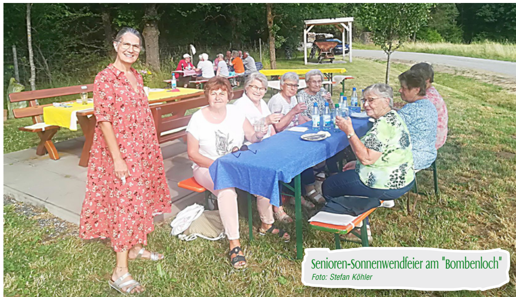
Senioren-Sonnenwendfeier am "Bombenloch"